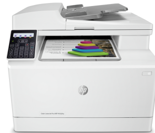
HP Color LaserJet Pro MFP M183fw

Denne printer er kun beregnet til at fungere med patroner, der har en ny eller genbrugt HP-chip, og den bruger dynamiske sikkerhedsforanstaltninger til at blokere patroner med en ikke-HP-chip. Regelmæssige firmwareopdateringer opretholder effektiviteten af disse foranstaltninger og blokerer patroner, der tidligere har fungeret. En genbrugt HP-chip muliggør brug af genbrugte, genfremstillede og genopfyldte patroner. Flere oplysninger på: http://www.hp.com/learn/ds