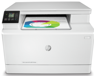
HP Color LaserJet Pro MFP M182n

En effektiv, trådløs MFP til farver i høj kvalitet. 2,1 Spar tid med Smart Tasks i HP Smart-appen, og udskriv og scan fra din telefon. 3 Få problemfrie forbindelser og vigtige sikkerhedsfunktioner, der sikrer beskyttelse af privatlivets fred og kontrol.